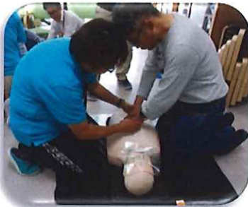
胸骨圧迫位置を確認中。 (目安は胸の真ん中)