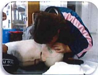
気道を確保し、口と鼻を覆い息を吹き込みます。