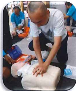
マッサージはしっかり強く!!