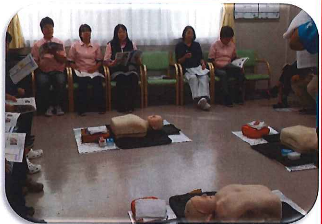
緊急事態に遭遇した場合に備え、スタッフも正しい知識と技術を身に付けました。