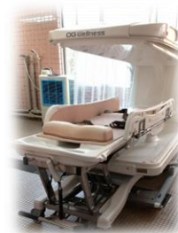
機械浴(臥床式シャワー浴)